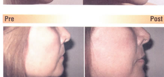
Delineado y aumento labio superior e inferior