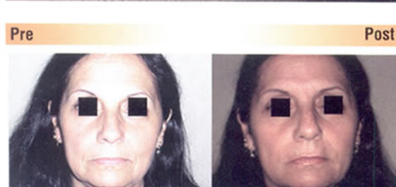
Delineado de labio superior e inferior, arco de cupido, surcos nasolabiales y líneas de marioneta