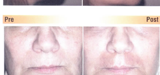
Delineado labial, arco de cupido, fil-trum y tubérculo bermellón. Combinado con dermoabrasión.