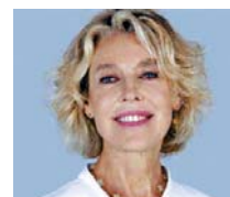
Velia Lemel Argentina